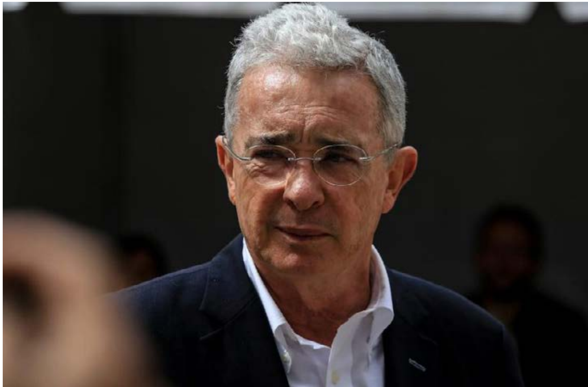
Uribe en libertad mientras falla el Tribunal Superior de Bogotá

El Centro Democrático de fiesta, celebrando la libertad de Uribe mediante tutela