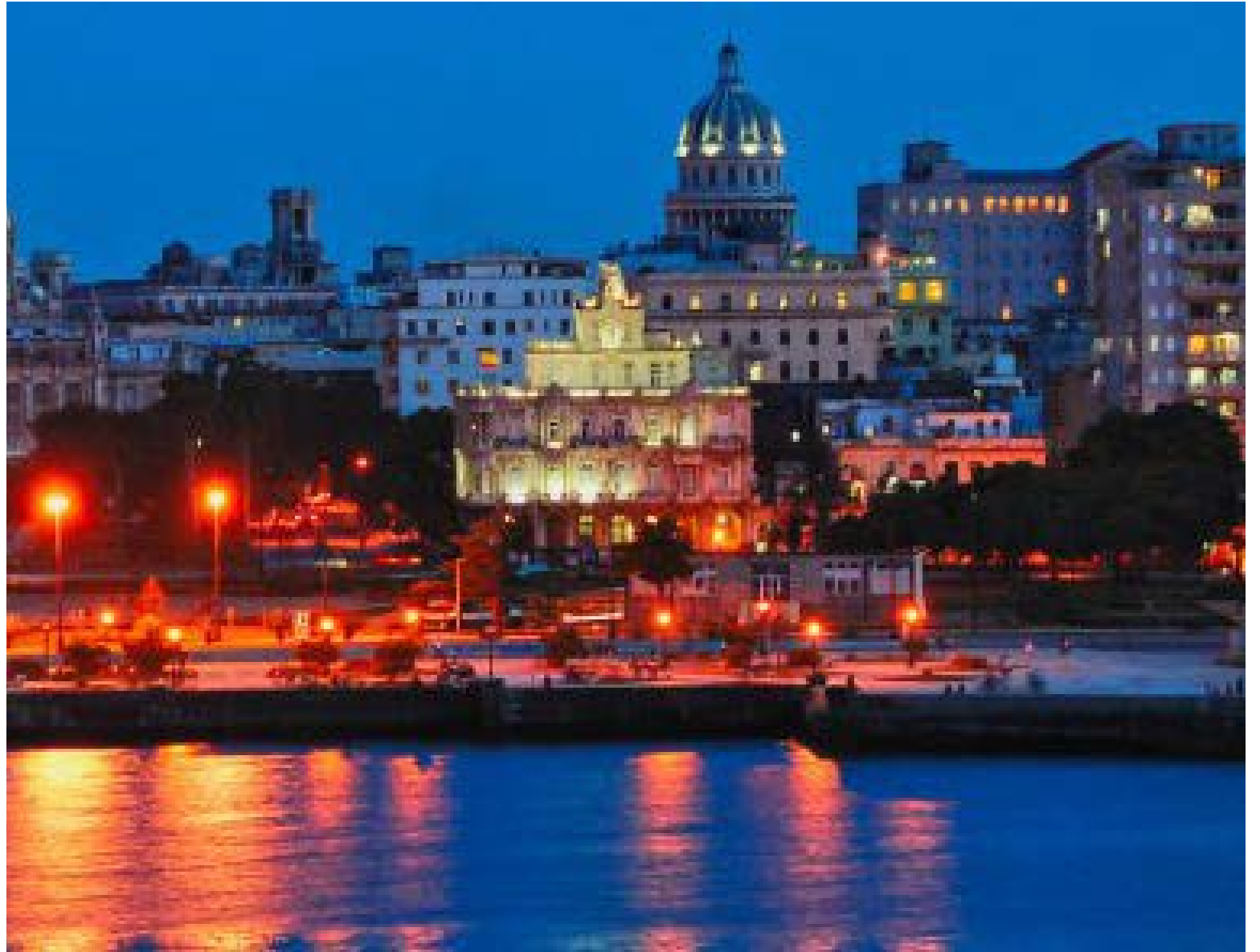
La Habana Vieja por la noche

El Templo, símbolo fundacional, transporta al visitante al primer Cabildo y a la imaginaria primera misa. Su columna conmemorativa, casi borrada por el tiempo, atestigua en latín: «Detén el paso, caminante, adorna este sitio con un árbol, una ceiba frondosa, más bien diré signo memorable de la prudencia y antigua religión de la joven ciudad, pues ciertamente bajo su sombra fue inmolado solemnemente en esta ciudad el autor de la salud. Fue tenida por primera vez la reunión de los prudentes concejales hace ya más de dos siglos: era conservado por una tradición perpetua: sin embargo, cedió al tiempo. Verás una imagen hecha hoy en la piedra, es decir