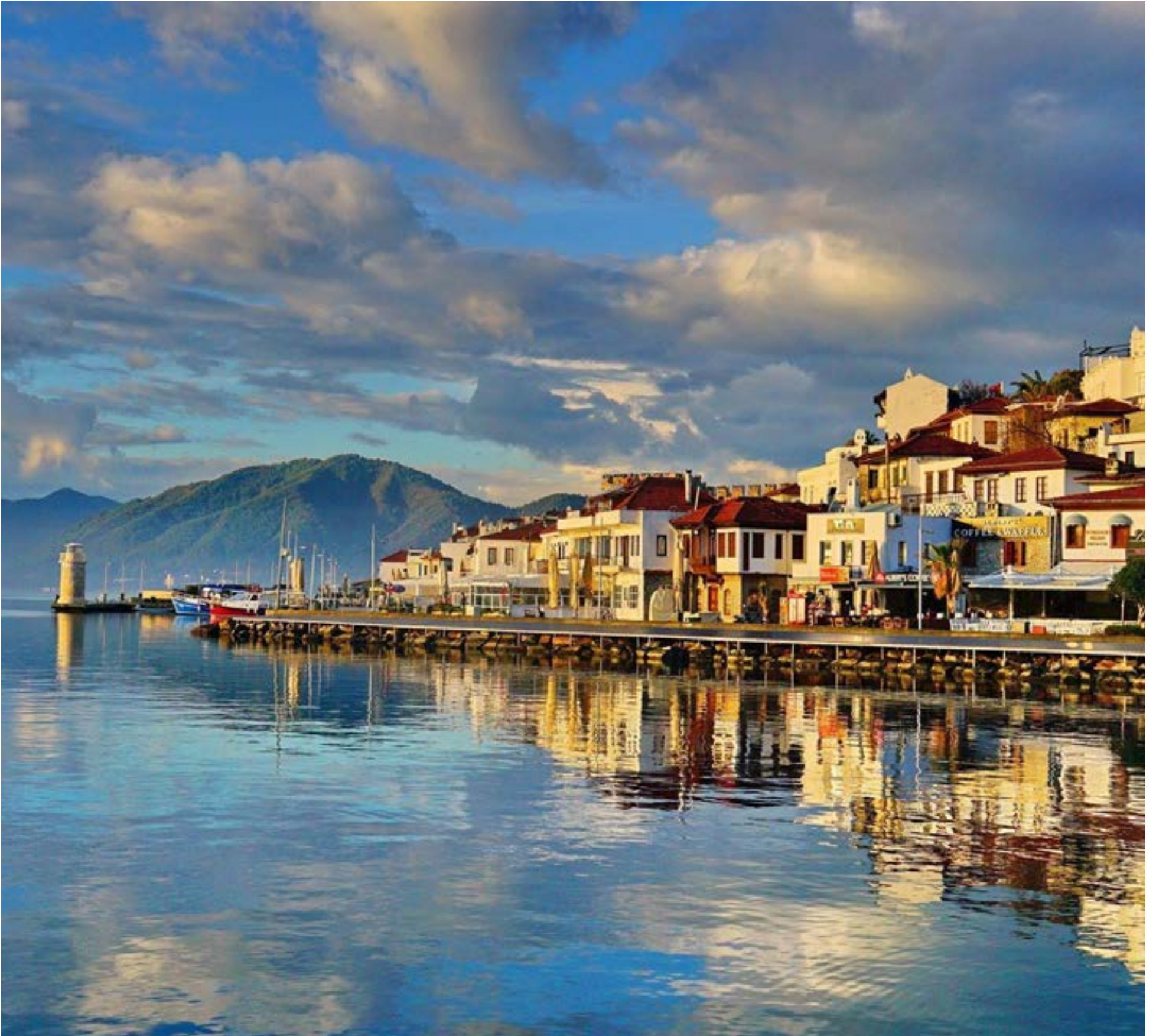
Marmaris es una ciudad y distrito costero de Turquía

una misión estrictamente sagrada: irradiar pasión por las creencias musulmanas. En la zona sur de esta construcción se halla una fabulosa biblioteca que alcanzó a tener cinco mil libros antiguos, donados, todos, por personajes que vivieron durante el siglo XVIII.