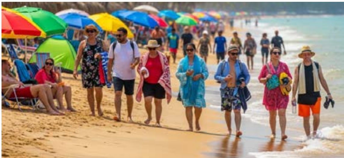
En Puerto Colombia, el mar Atlántico es el escenario perfecto para los turistas.

El Gobierno colombiano, con el respaldo estratégico de la Armada Nacional, ha puesto en marcha un exhaustivo plan de seguridad diseñado para garantizar la tranquilidad y el bienestar de los turistas que se movilizarán por las zonas costeras y fluviales del país durante el marco de la temporada vacacional de mitad de año.