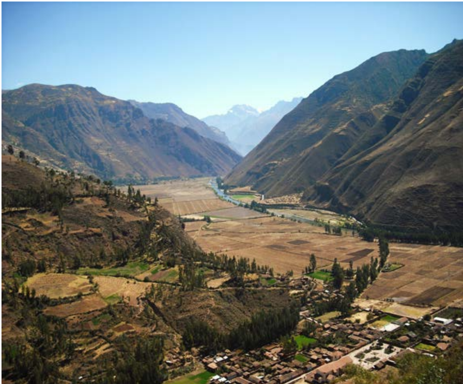
Valle Sagrado de los Incas, ubicado en la región Quechua, hoy conocida como Urubamba

Perú es un país de América del Sur, situado en el lado occidental de dicho continente, frente al Océano Pacífico Sur y se extiende sobre parte de la cordillera de los Andes que corre a lo largo de América del Sur. Perú limita con Ecuador y Colombia al norte, Brasil y Bolivia al este, y Chile al sur. El Perú es un país