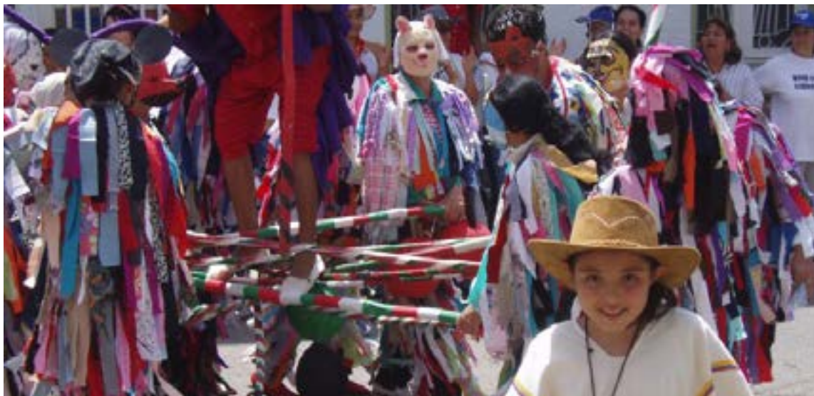
Alegoría a las danzas pijao Baile de matachines

Superados estos escollos, arriban al Valle de las Lanzas, denominación dada porque los originarios únicamente empleaban lanzas; iniciándose en la meseta fieros enfrentamientos con los milenarios Panches y Pijaos, doblegados por las novedosas armas de fuego hispana. Luego, los caciques Titamo y Quicui se conjuntaron y prepararon una nueva arremetida, obligando a López de Galarza, de Prado y Bretón