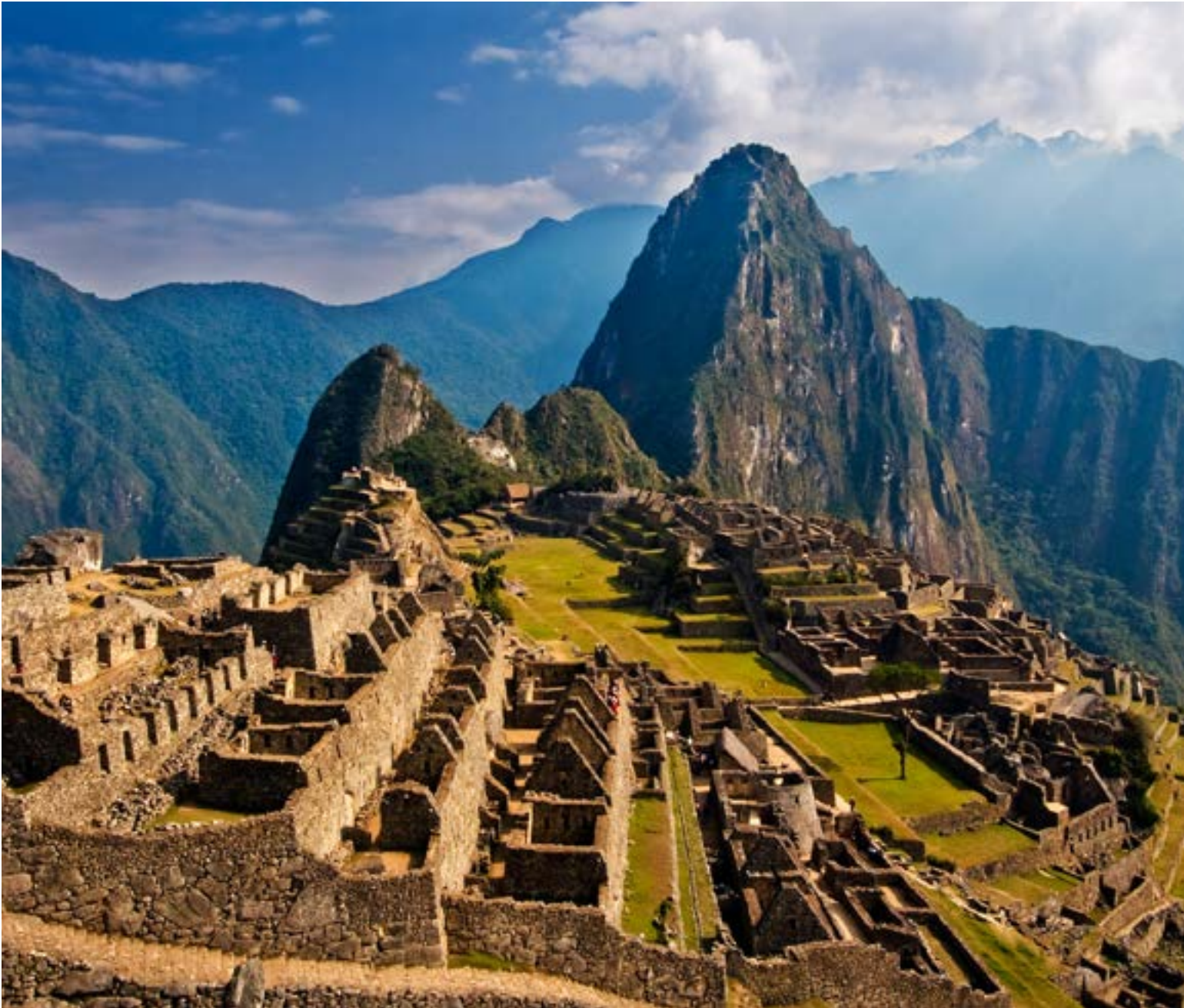
Machu Picchu ícono de la arquitectura incaica

biendo también muchos otros dialectos menores.