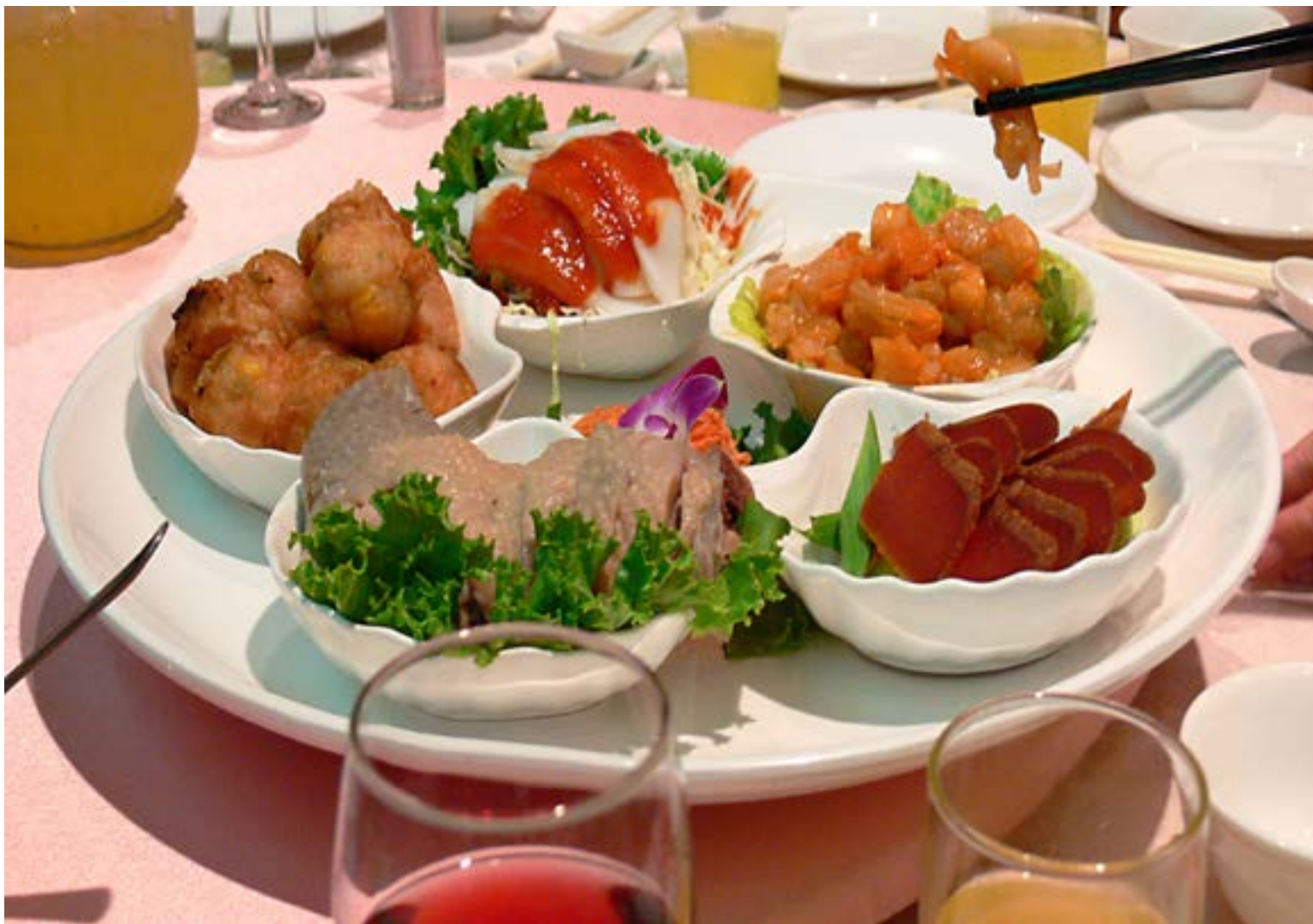
Comida taiwanesa servida en una boda.

La característica de la cocina de Sichuan es que logra sabores deliciosos con alimentos normales y corrientes. La carne de pollo, las verduras y el tofu, en manos de un cocinero sechuanés se convierten en platos especiales y exquisitos. Es normal el sabor picante muy fuerte, que llegan a entumecer, así como sabores agridulces y salados, que hacen las comidas más apetitosas.