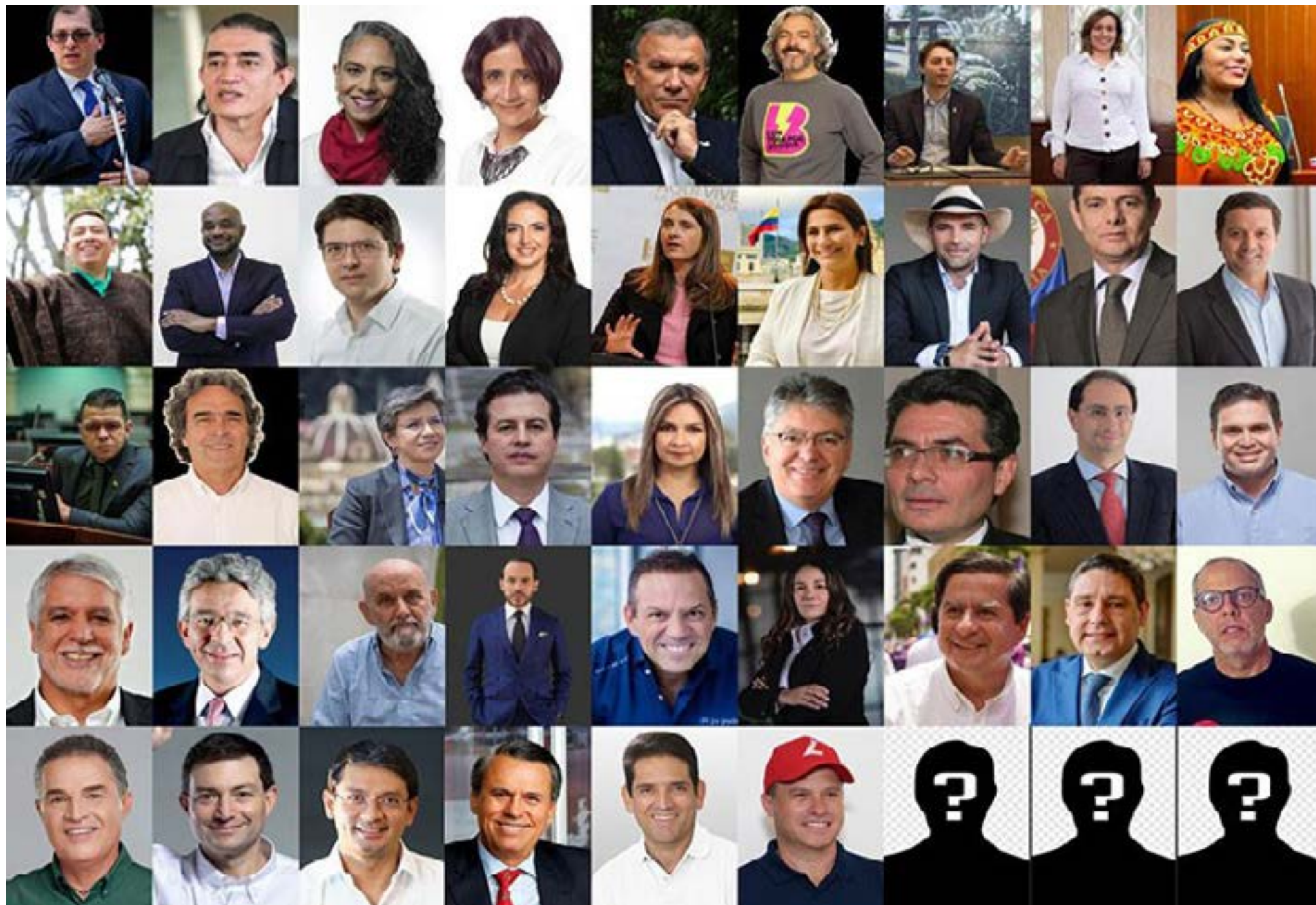
Todos los días aparecen nuevos precandidatos